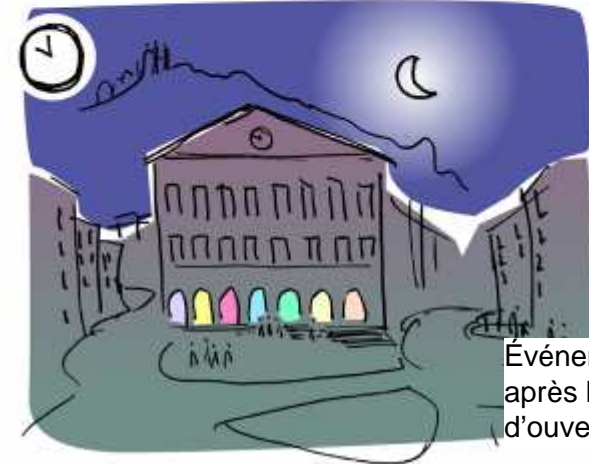
Événements créatifs après les horaires d'ouverture de la gare