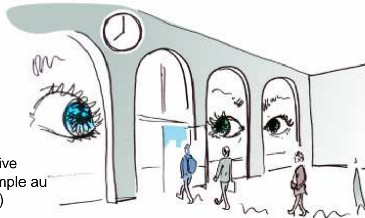
Installation interactive (qui réagit par exemple au flux des navetteurs)

→ Différents types de contenus en fonction de l'heure de la journée