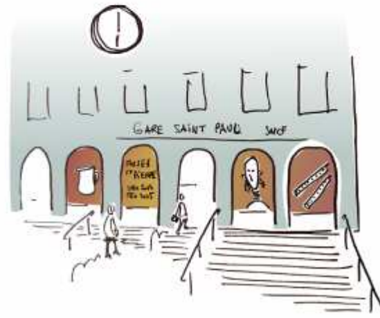
Promotion de l'activité créatrice sur l'agglomération