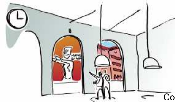
Contenus informatifs pour les touristes